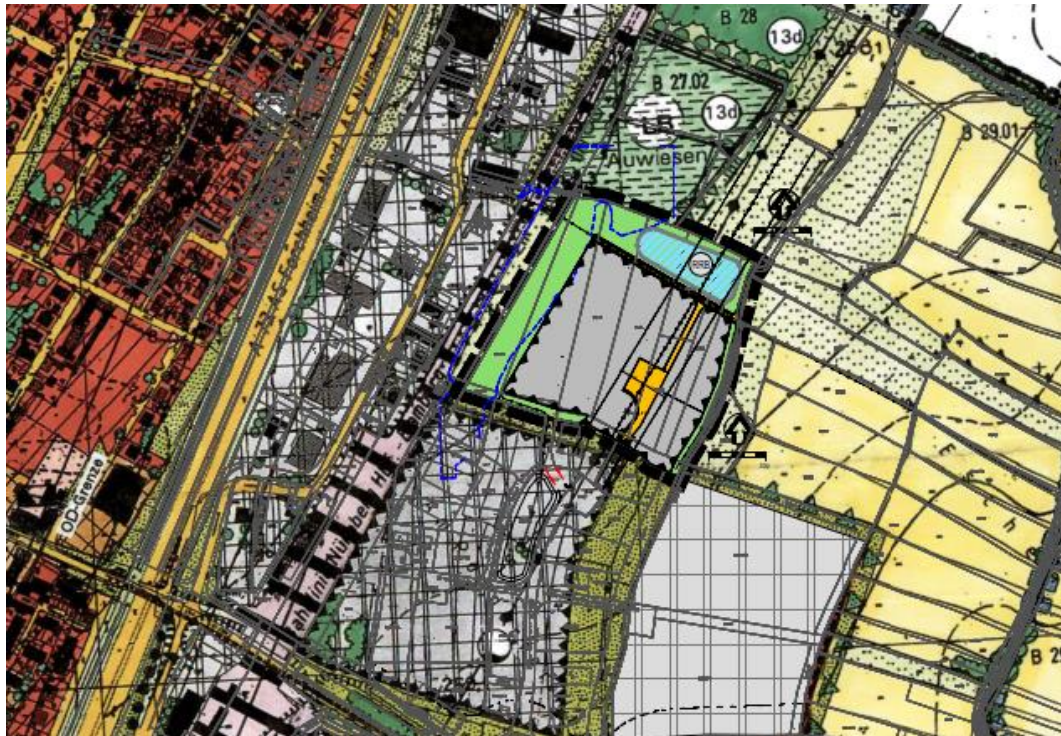
Darstellung im geänderten Flächennutzungsplan der Stadt Baiersdorf

Entsprechend der beabsichtigten Nutzung werden die Bauflächen als gewerbliche Baufläche gemäß § 1 Abs.1 Nr. 3 BauNVO dargestellt.