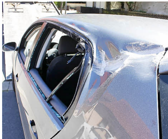
Vom Auflieger eines Sattelzuges wurde dieser Golf gestern Mittag in Etzelskirchen stark beschädigt.