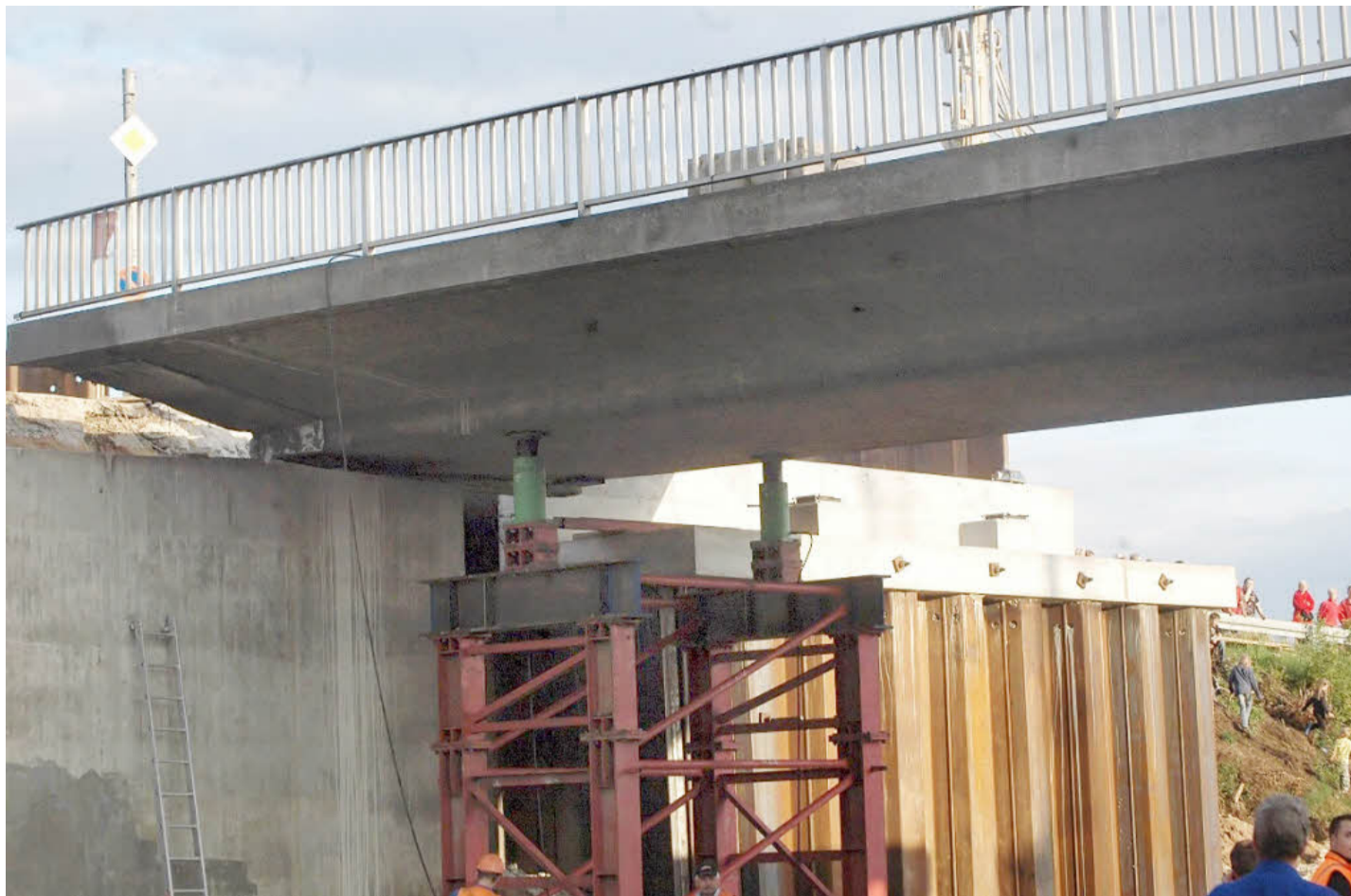
Die bisherige Jahnbrücke wurde angehoben und um zwölf Meter in Richtung Süden verschoben. An ihrer Stelle entsteht ein Neubau.